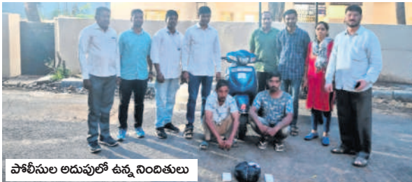
పోలీసుల అదుపులో ఉన్న నిందితులు